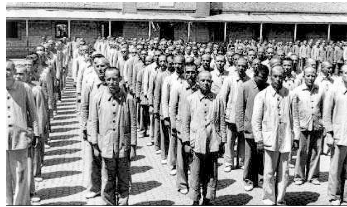
Imagen anónima de los años 40, posiblemente realizada por un funcionario, del patio de la prisión central.

varez Oreni, primero en El periódico del Guadalete y posteriormente en Información .