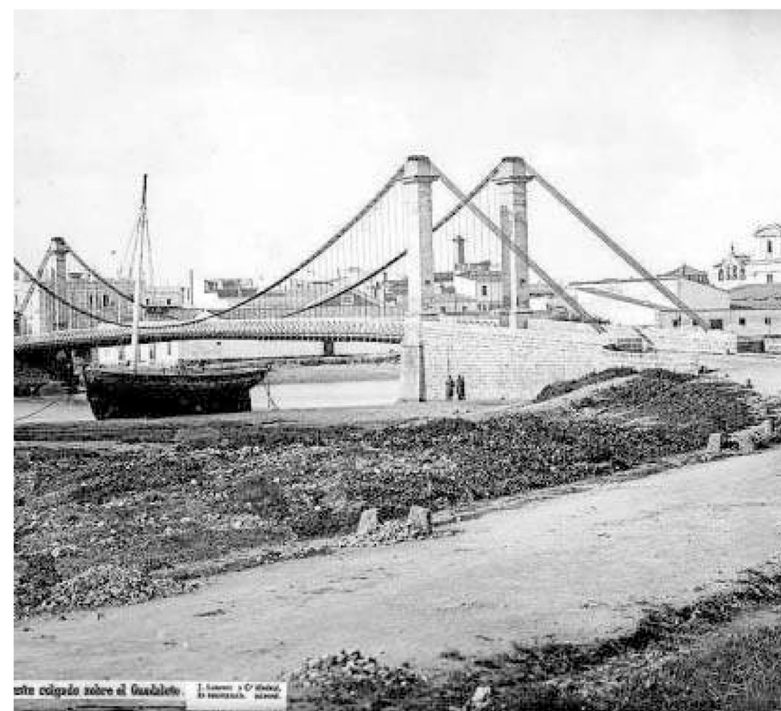
Imagen realizada por el francés Jean Laurent en 1867 del puente colgado sobre el río Guadalete.

1986 Comienzan a publicar imágenes en prensa Agustín Al-