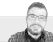
JOSÉ ANTONIO TEJERO

1925 Se presenta la Cámara Leica por Oscar Barnack. Aparecen los primeros flashes electróni-