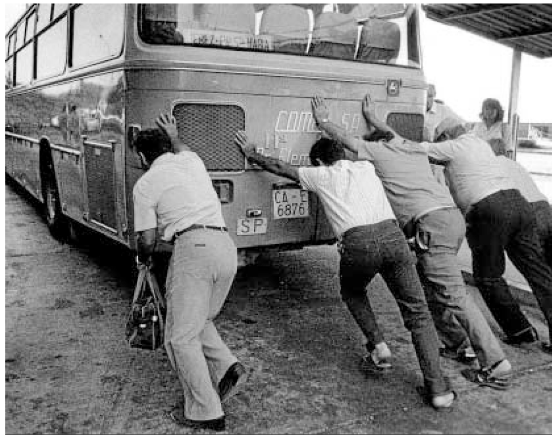
Fotografía singular fechada en 1988 de ciudadanos intentando poner en marcha un autobús Comes.

diz en la casa esquina entre la Plaza de San Antonio y la calle Buenos Aires. Fox Talbot presenta el calotipo o talbotipo como primer negativo en papel.